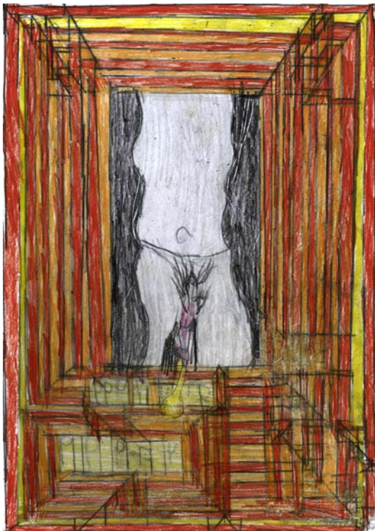
Josef Hofer sans titre, 2011 mine de plomb et crayon de couleur sur papier, 42 x 29,7 cm Collection de l'art Brut, Lausanne

L'exposition réunira plus de 50 dessins, le grand miroir de Josef Hofer et un film documentaire sur lui ( Reflections from the outside , Chris Lewis, Crewhouse, 2007, version originale allemande, sous-titré en français).